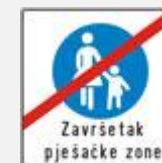
ZAVRŠETAK PJEŠAČKE ZONE