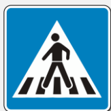
OBIJEŽEN PJEŠAČKI PRIJELAZ