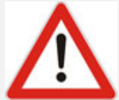
OPASNOST NA CESTI