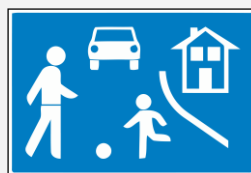
PODRUČJE SMIRENOG PROMETA