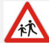
DJECA NA CESTI