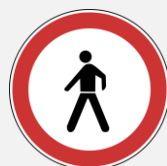
ZABRANA KRETANJA ZA PJEŠAKE