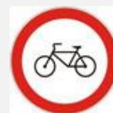
ZABRANA PROMETA ZA BICIKLE