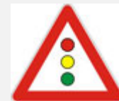
NAILAZAK NA PROMETNA SVJETLA