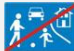
ZAVRŠETAK ZONE SMIRENOG PROMETA