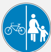
BICIKLISTIČKA I PJEŠAČKA STAZA