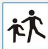
DJECA NA CESTI