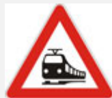
PRIJELAZ CESTE PREKO PRUGE BEZ BRANIKA I POLUBRANIKA