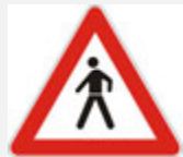
PJEŠACI NA CESTI