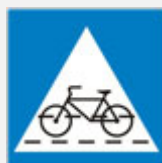
OBIJEŽEN PRIJELAZ BICIKLISTIČKE STAZE